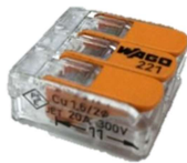
②ワンタッチコネクタ