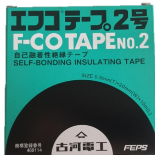
④自己融着性絶縁テープ